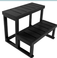
ESCALIER 2 MARCHES