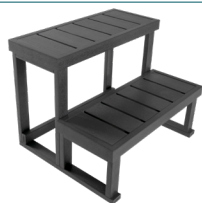
ESCALIER 2 MARCHES