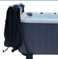
LÈVE-COUVREURE FIXATION SOUS SPA