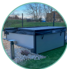
COUVERTURE ISOLANTE INCLUSE