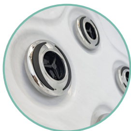
DIVERSITÉ DE MESSAGES

Notre spa SUMATRA s'intégrera parfaitement dans votre environnement, il est facile d'accès de part sa petite hauteur. Sa marche intérieure permet une accès facile dans votre spa, idéal pour les personnes ayant des problèmes de motricité.