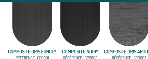
COMPOSITE GRIS FONCÉ* RÉFÉRENCE : CP0001