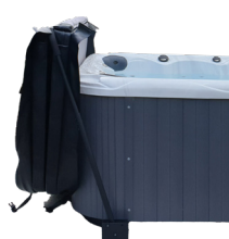
LÈVE-COUVERTURE FIXATION SOUS SPA

Réf : ESC002 Escalier 2 marches composite noir