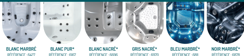
BLANC MARBRÉ RÉFÉRENCE : 6427