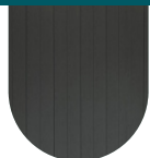
COMPOSITE GRIS FONCÉ* RÉFÉRENCE : CP0001

* COLORIS SUR COMMANDE. AUTRES COULEURS DISPONIBLES SUR LE SITE WWW.BE-SPA.FR